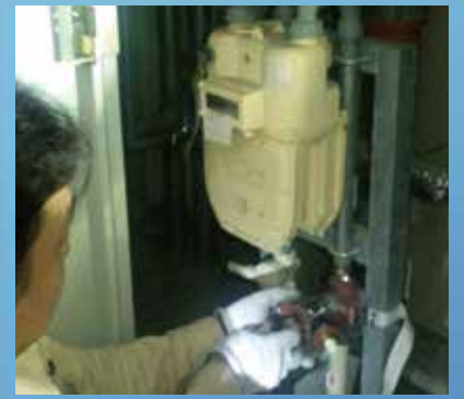
▲膜式メーター交換作業(例)