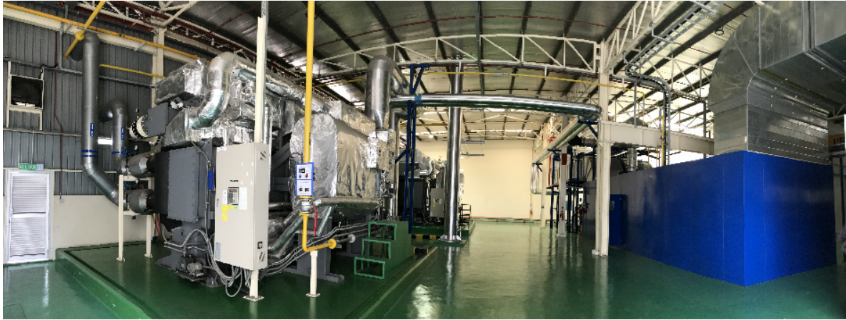
PAPAMY 社で運用を開始した発電・空調システム（右：コージェネ、左：ジェネリンク）