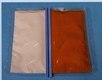
混合前のパッケージ