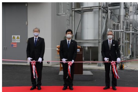
竣工式のテープカットの様子