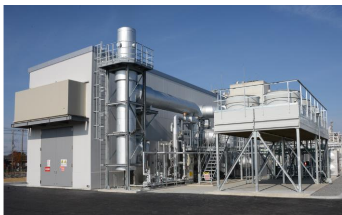
今回導入した CGS（新設）

※6 停電状態で発電機を自立起動させ運転を再開する方式。災害に強い中圧ガス導管を活用することにより、系統電力が停電しても供給継続できます。