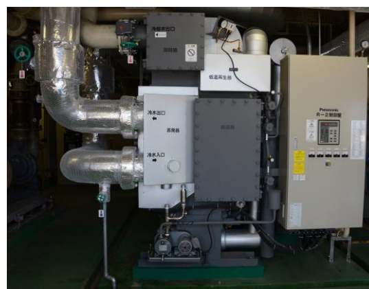
CGS の廃熱で製造した蒸気を利用して冷房を行う ナチュラルチラー（既存）