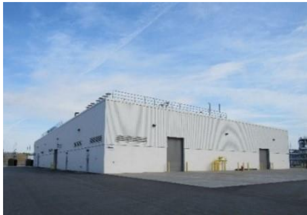
TGES アメリカ エネルギープラント外観

TGES アメリカは、2016年10月より、スパルタンバーグ工場に対して、工場に隣接するエネルギープラントにユーティリティ設備を設置し、蒸気・冷水・冷却水・純水・圧縮空気を供給するとともに、エネルギープラント建屋の設計から建設、設備運用、メンテナンスまで一括して担当する総合的なユーティリティサービス事業を行っています*1。今回のサービス拡大は、CMA のスパルタンバーグ工場の生産増強計画*2に対応するもので、TGES アメリカがユーティリティ設備を増設し、2025年から供給を開始する予定です。